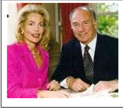
Kerim Aga Khan IV ayrıldığı ilk eşi Sally Croker Poole ile ayrılırken 20 milyon sterling nafaka ödedi

Zarkava- 3 yaşında Arc de Triomphe dahil 7 koşu kazandı. Hiç geçilmedi.