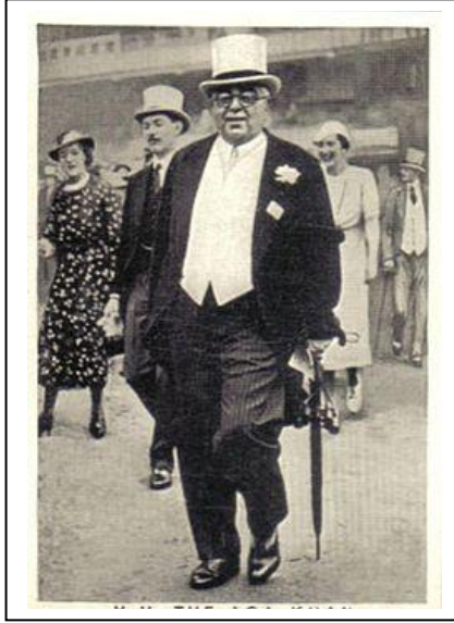
Aga Khan III

İNSAFLI davranılması gerektiğini savunarak Türklerin sempatisini kazandı. 1937 de Milletler Cemiyeti Başkanlığına seçildi. 1940 larda siyaseti bırakarak İsviçre'ye yerleşti. Aga Khan'lar uzun yıllar evvel Hindistan'da at yetiştirmeye ve koşturmaya meraklı idiler. Modern Dünya Yarışçılığında da yetiştirdikleri atlarla büyük başarılarla imza attılar.