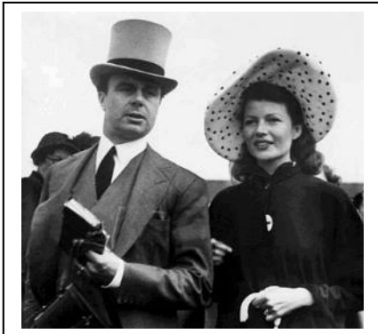
Aga Khan III ün ortanca oğlu Prince Ali Khan daha çok manialı yarış dünyasıyla ilgilendi. Playboy olarak tanınırdı ve zamanın en güzel film artisti GİLDA'nın yıldızı Rita Haywort ile evlendi.

Aga Khan'lar 1800 lerden itibaren isimlerini duyurdular. Aga Khan III'ün 1898 deki İngiltere ziyaretinden sonra Avrupa'da yerleşmeye karar verdiği söylenir. 1935 Triple Crown galibi BAHRAM ve BLENHEIM II ile Avrupa operasyonuna başladı. 1960 yılında Prince Aly Khan'ın ölümünden sonra iki oğlu Kerim ve Aryn ile kızı Prenses Zahra mirasçılardı. Oğullar ayrı ayrı 2/5 hisselerine kızı 1/5 hisseye sahipti. Kerim Khan kardeşlerinin haralardaki hisselerini satın alarak atçılık sektöründe kalmaya karar verdi. Sonrası malum. Dünyanın 5 kıtasında toplam 600 atlı bir eküri ve birbirinden değerli kısraklar. Ve parola: "Breed the best to the best" yani "en iyiyi en iyiyeye". Haralarında Marcel Boussac kısrakları temel malzemeyi oluşturmuştur. Kerim Aga Khan 6 Milyar Sterling'lik mal varlığı ile dünyanın en zengin ilk on kişisi arasında yer almaktadır. Sayısız gazeteleri, beş ve yedi yıldızlı otelleri, mükemmel yatları ve inanılmaz mücevher koleksiyonları ile sınırsız zenginliğini renklendirmektedir. İrlanda'nın ve Fransa'nın en mümbit ve haracılığa en müsait topraklı arazilerini seçmiş ve ayrıca "Dozaj Teorisi"nin yaratıcısı Jean Joseph Vullieri'de yanına almıştır. Kulakları çınlasın